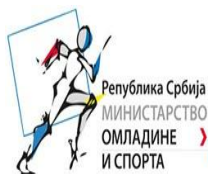
МИНИСТАРСТВО О ОМЛАДИНЕ И СПОРТА