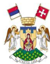
ОПШТИНА ВРЊАЧКА БАЊА